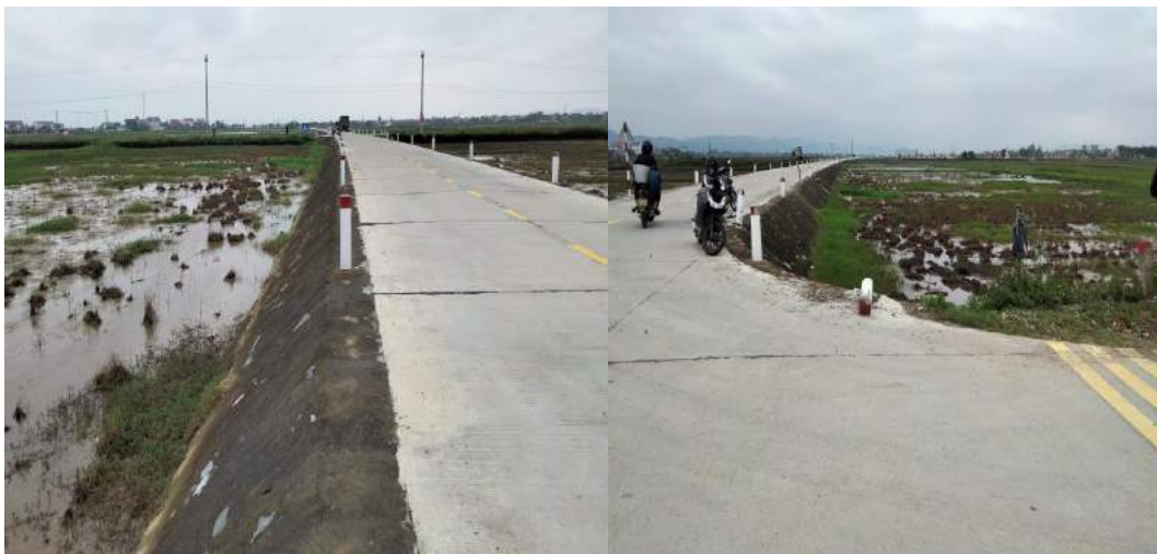
Hình 1.2. Hình ảnh hiện trạng khu vực dự án