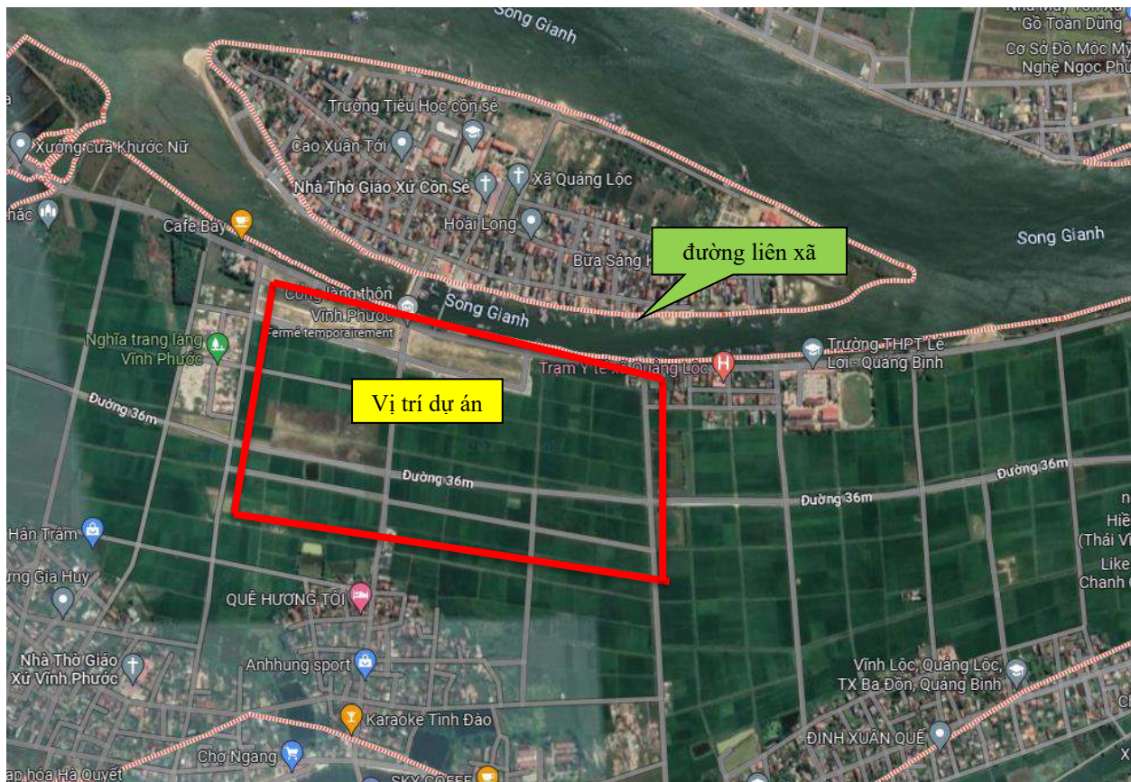
Hình 1.1: Sơ đồ vị trí khu vực dự án