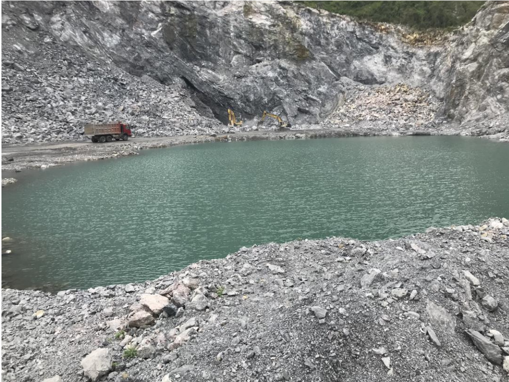
Hình 1. Ao lắng khu vực khai trường của mỏ

Riêng đối với khu vực mỏ (moong khai thác) đã có ao lắng để thu gom nước mưa chảy tràn và lắng cặn tại khu vực này trước khi thoát nước theo mương thoát phía Đông Bắc khu mỏ.