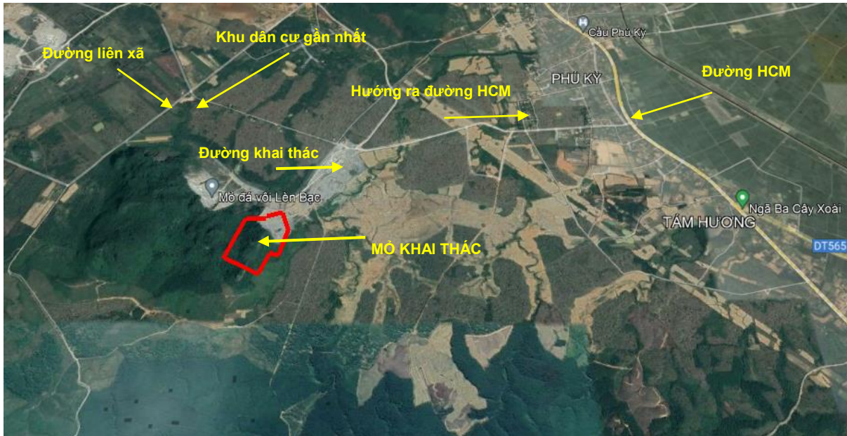
Hình 1.1. Tổng quan khu vực mỏ

Sơ đồ vị trí khu vực dự án được thể hiện như hình sau: