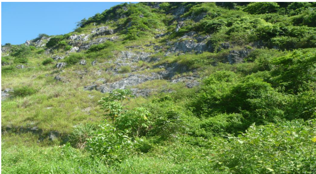
Hình 2.1. Ảnh bề mặt mỏ đá lèn Bạc

Phía Đông Bắc khu vực khai thác, dưới chân núi, địa hình khá bằng phẳng, thuận lợi cho việc làm bãi khai thác, chế biến khoáng sản. Công ty đã làm thủ tục thuê đất từ năm 2018 để làm bãi chứa đá và khu phụ trợ. Khu vực làm bãi chứa đá và khu phụ trợ là vùng đất tương đối bằng phẳng. Về mùa mưa, nước mưa chảy tràn từ khu phụ trợ, khu vực xung quanh khu phụ trợ chảy theo hướng nghiêng địa hình chảy vào ao lắng để thu gom nước mưa chảy tràn và lắng cặn tại khu vực này trước khi thoát nước theo mương thoát phía Đông Bắc khu mỏ.