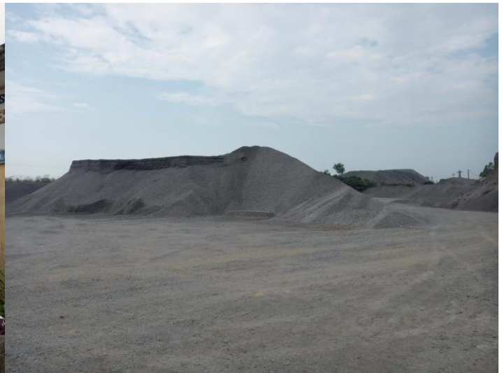
Hình 1.5: Khu phụ trợ