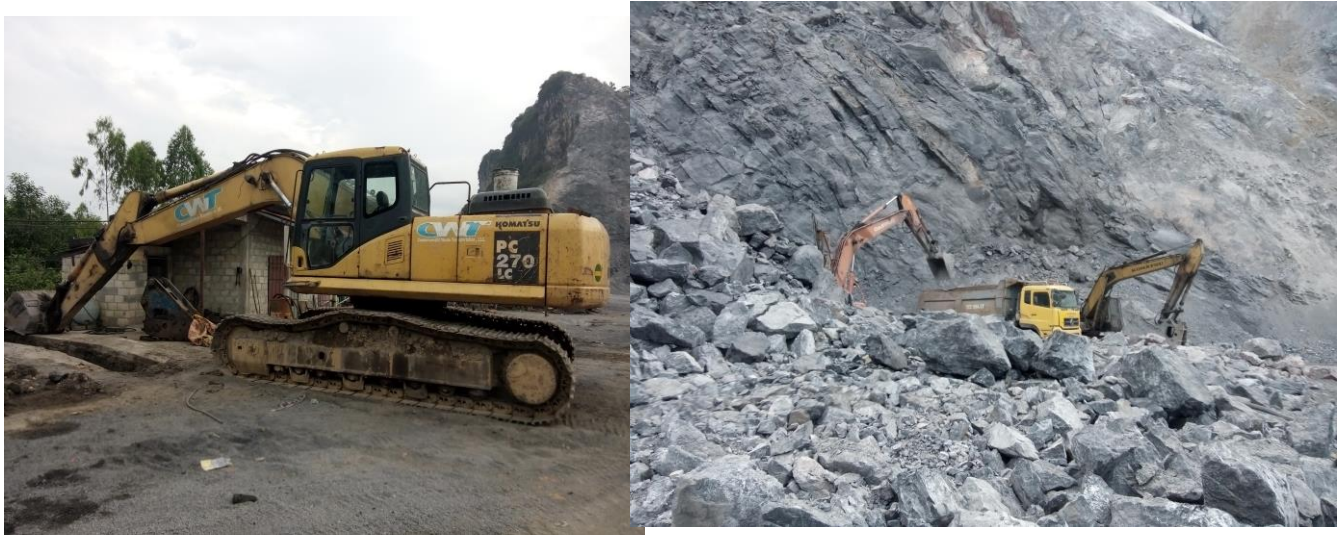
Hình 1.8: Máy xúc tại mỏ