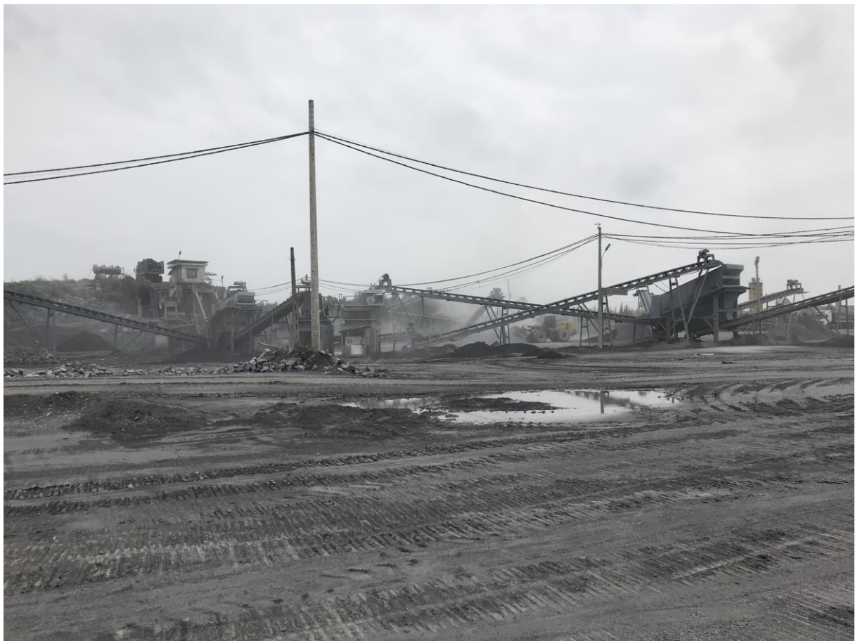
Hình 1.4. Hiện trạng khai thác mỏ đá vôi Lèn Bạc