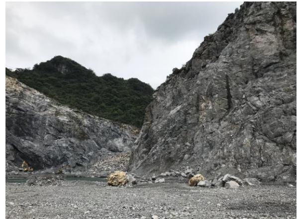
Hình 1.3. Hiện trạng khu đất Dự án