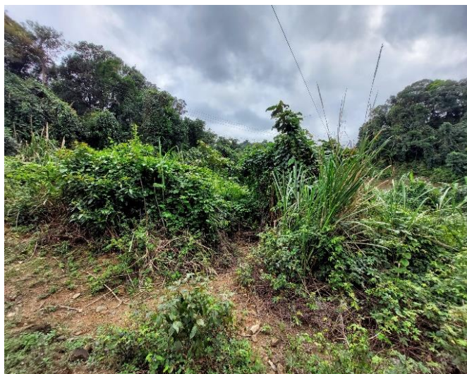
Hình 1.1: Hiện trạng khu vực Dự án

- Diện tích đất làm đường chiếm dụng dự kiến 18,2ha. Trong đó: Diện tích rừng chiếm dụng khoảng 13ha; Diện tích cây cối hoa màu của dân bản dự kiến thu hồi khoảng 2,6 ha; Diện tích đất trong phạm vi đã được quy hoạch khoảng 2,6ha. Hiện nay, khu vực tuyến đường đi qua chủ yếu là đất hoa màu của nhân dân, không đền bù tài sản nhà cửa trên diện tích đất phải thu hồi.