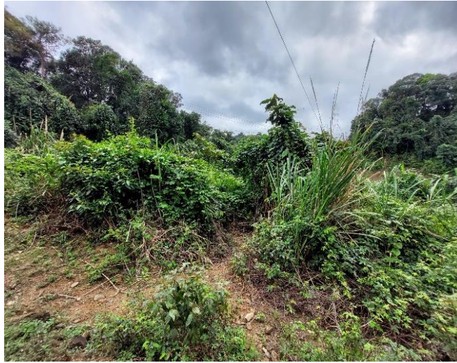
Hình 1.1: Hiện trạng khu vực Dự án

- Diện tích đất làm đường chiếm dụng dự kiến 18,2ha. Trong đó: Diện tích rừng chiếm dụng khoảng 13ha; Diện tích cây cối hoa màu của dân bản dự kiến thu hồi khoảng 2,6 ha; Diện tích đất trong phạm vi đã được quy hoạch khoảng 2,6ha. Hiện nay, khu vực tuyến đường đi qua chủ yếu là đất hoa màu của nhân dân, không đền bù tài sản nhà cửa trên diện tích đất phải thu hồi.