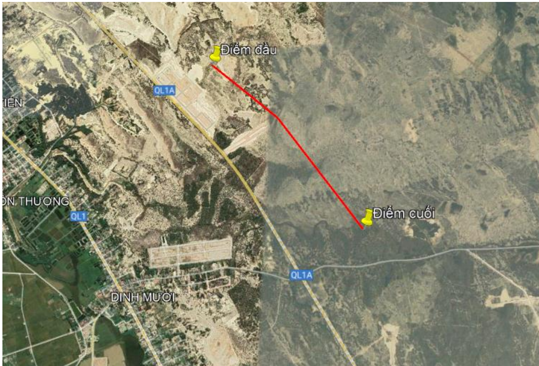
Hình 1.1. Vị trí khu vực dự án