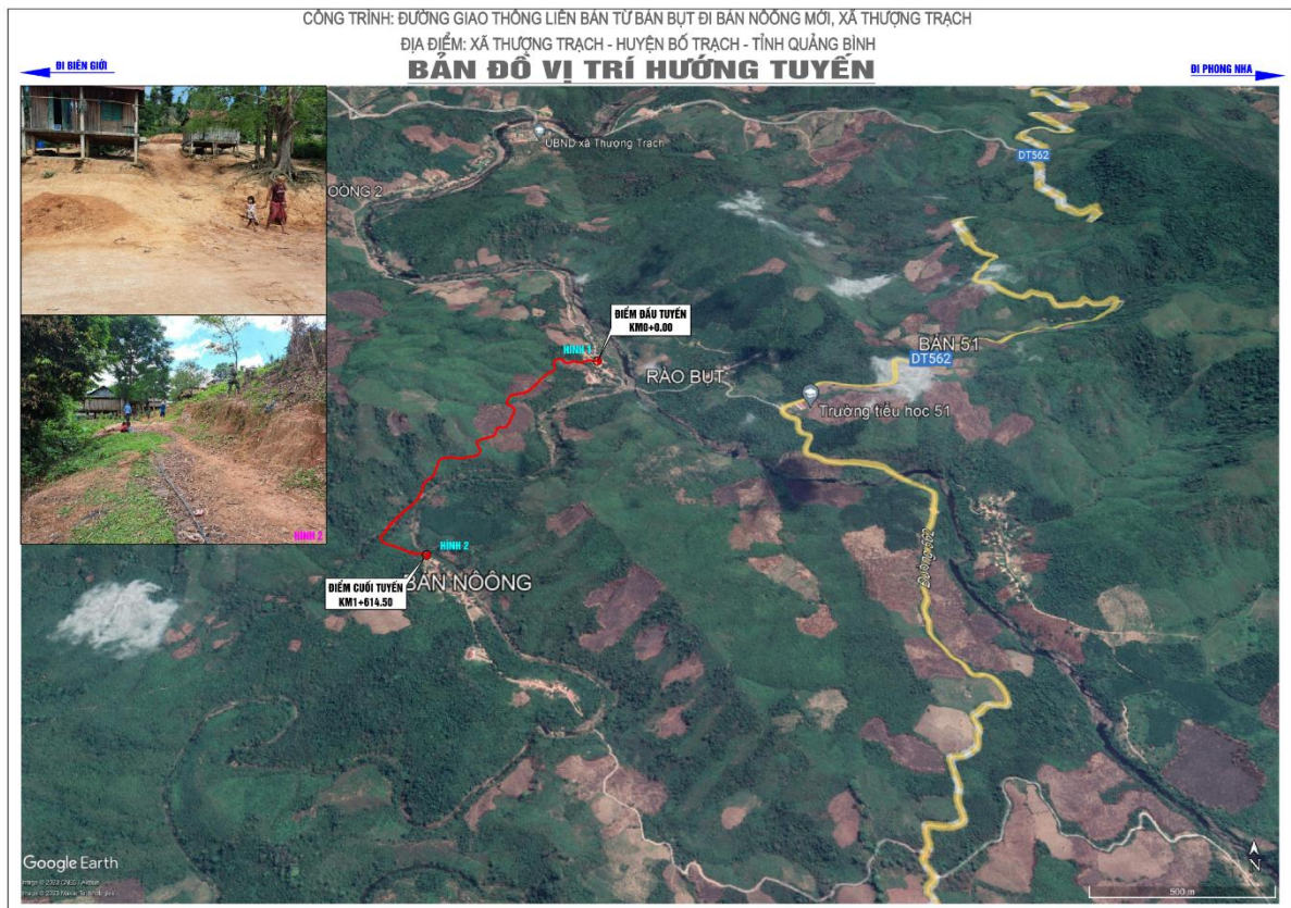
Hình 1.1. Vị trí khu vực dự án

Vị trí thực hiện dự án được mô tả ở hình sau: