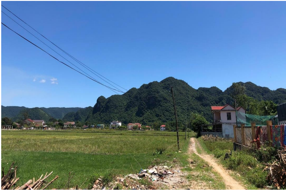
Hình 1.1: Hiện trạng đoạn đầu tuyến

- Đoạn đầu tuyến Từ Km0+0,00 đến Km0+490,68: Hiện trạng tuyến chưa có đường cũ, 2 bên tuyến là ruộng lúa.