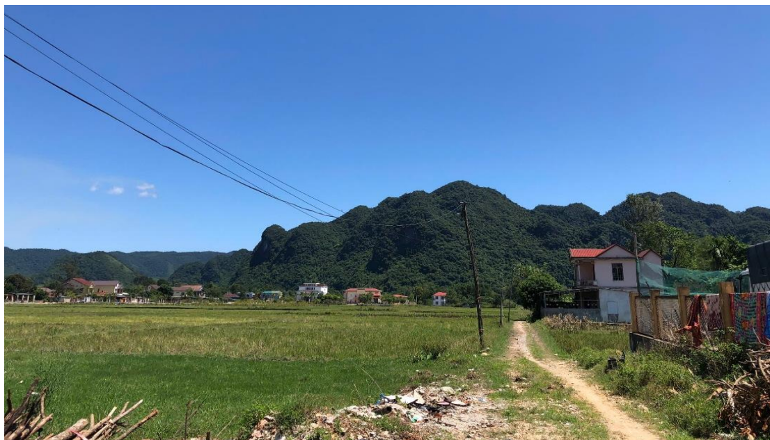
Hình 1.1: Hiện trạng đoạn đầu tuyến

- Đoạn đầu tuyến Từ Km0+0,00 đến Km0+490,68: Hiện trạng tuyến chưa có đường cũ, 2 bên tuyến là ruộng lúa.