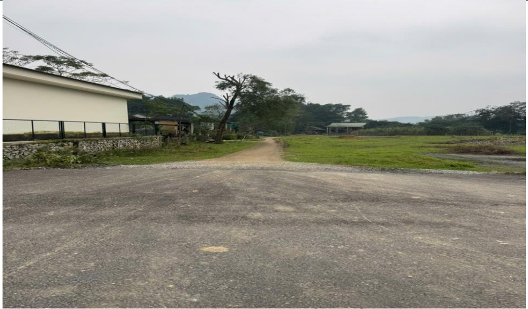
Hình 1.2: Hiện trạng đoạn cuối tuyến