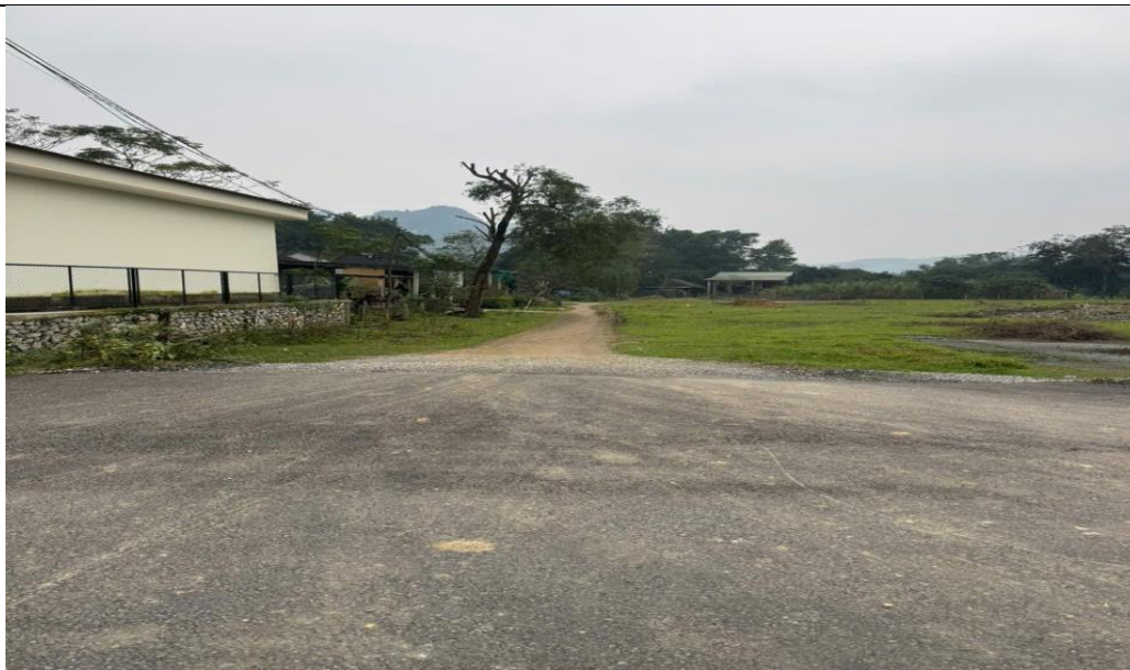
Hình 1.2: Hiện trạng đoạn cuối tuyến