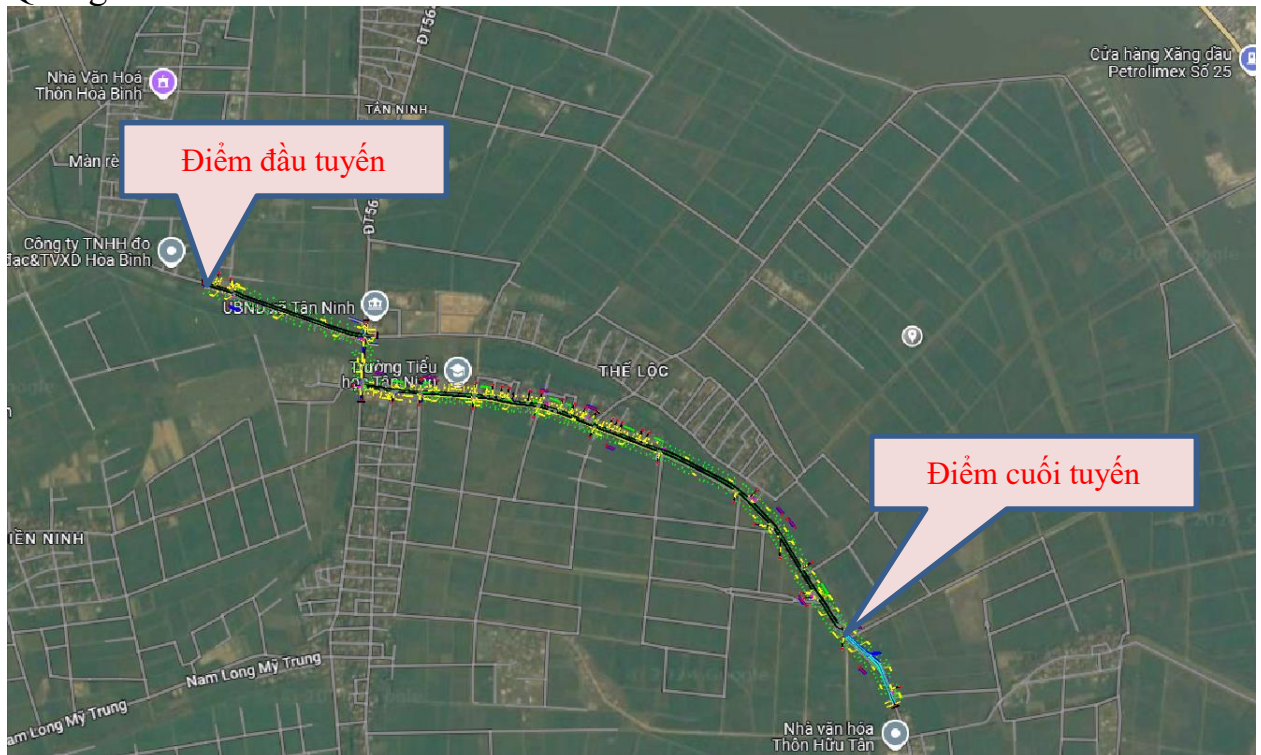
Hình 1.1: Sơ đồ vị trí khu vực dự án

- Đầu tư nâng cấp tuyến đường theo quy hoạch được duyệt với tổng chiều dài 2,6km nằm trong quy hoạch chung xây dựng xã An Ninh - Tân Ninh; điểm đầu Km0+00 tại vị trí cây đa thôn Hoà Bình thuộc địa phận xã Tân Ninh; điểm cuối Km2+600 tại vị trí đầu thôn Hữu Tân xã thuộc địa phận xã Tân Ninh, huyện Quảng Ninh.