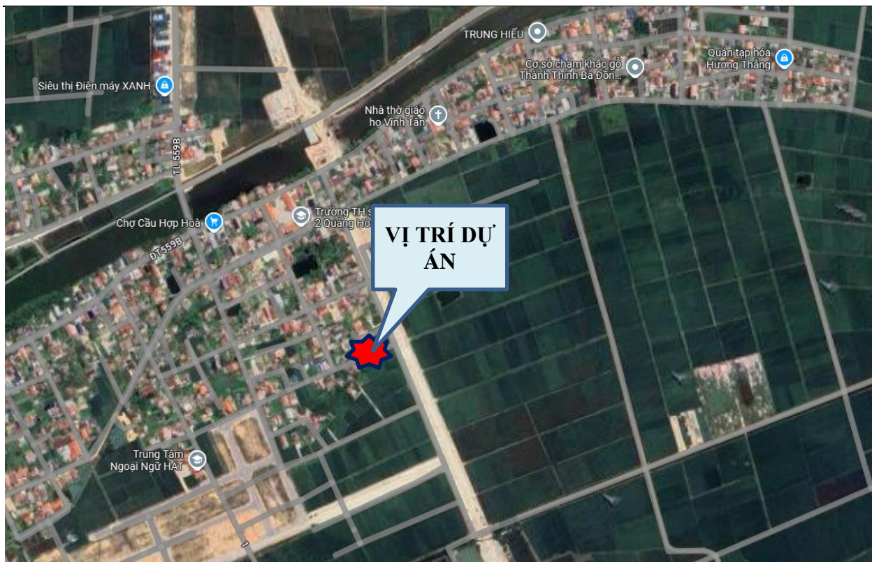
Hình 1.3. Sơ đồ vị trí thực hiện dự án

Báo cáo ĐTM dự án: Hạ tầng tuyến đường từ cầu Quảng Hải kết nối các tuyến đường trục chính qua các xã vùng Nam, thị xã Ba Đồn (Giai đoạn 1). Khoản mục: Đầu tư cơ sở hạ tầng khu vực tái định cư xã Quảng Hoà để thực hiện GPMB công trình. Thuộc hạng mục: Chi phí bồi thường, hỗ trợ và tái định cư.