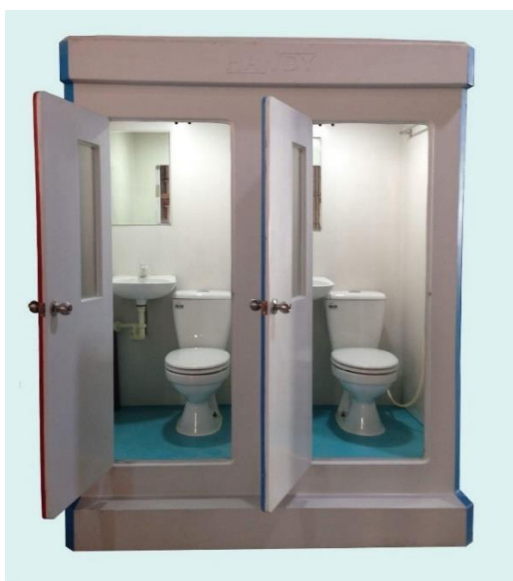
Hình ảnh minh họa nhà vệ sinh di động

+ Vật liệu chế tạo bằng composite nên không bị han rỉ hay lão hóa, không bay màu.