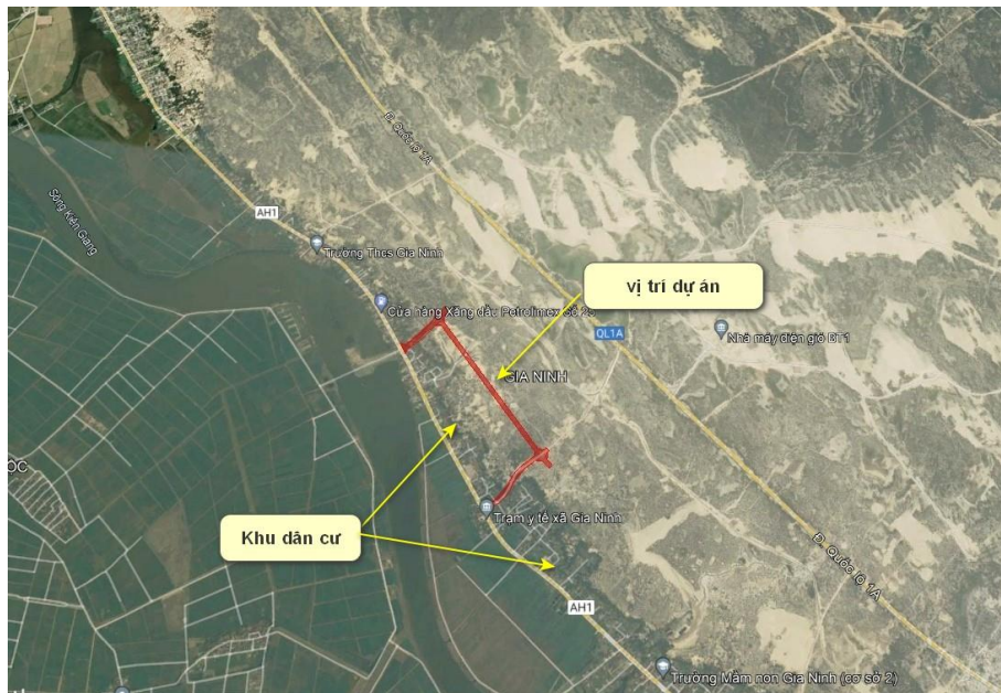
Hình 1.1. Vị trí thực hiện dự án

Xã Gia Ninh, huyện Quảng Ninh, tỉnh Quảng Bình.