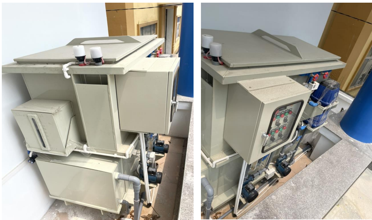
Hình ảnh: Hệ thống xử lý nước thải tập trung (dạng hợp khối)

Nước thải sau khi xử lý đạt quy chuẩn QCVN 14:2008/BTNMT (Cột B) - Quy chuẩn kỹ thuật quốc gia về nước thải sinh hoạt theo hệ thống thoát nước mưa của dự án trước khi thoát ra hệ thống thoát nước mưa của khu vực.